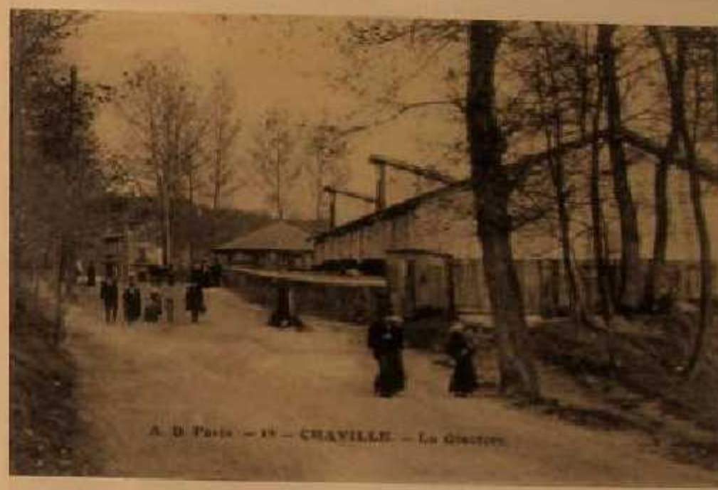
A. D. Paris - 19 - CHAVILLE - La Glacière