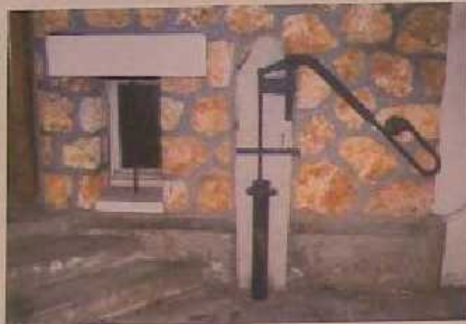
Fouquet restaurant - Rue de Stalingrad à Chaville - Archives 2004

En forêts de Fausses Répezes et de Meudon ainsi que sur les coteaux, les sources sont nombreuses. Certaines sont captées, comme celle de la guinguette Barnaud, à l'emplacement du restaurant actuel de la Pergola à l'Ursine. L'enseigne de la guinguette était « A la source ferrugineuse » car l'eau était chargée de fer. Cette source a alimenté les habitants de l'Ursine avant l'arrivée dans les années 1910 des canalisations d'eau potable. Le propriétaire de cette guinguette que l'on voit en train de goûter l'eau, Louis Barnaud, fut Maire de Chaville de 1919 à 1929. Cette source fut l'objet de nombreuses publications médicales.