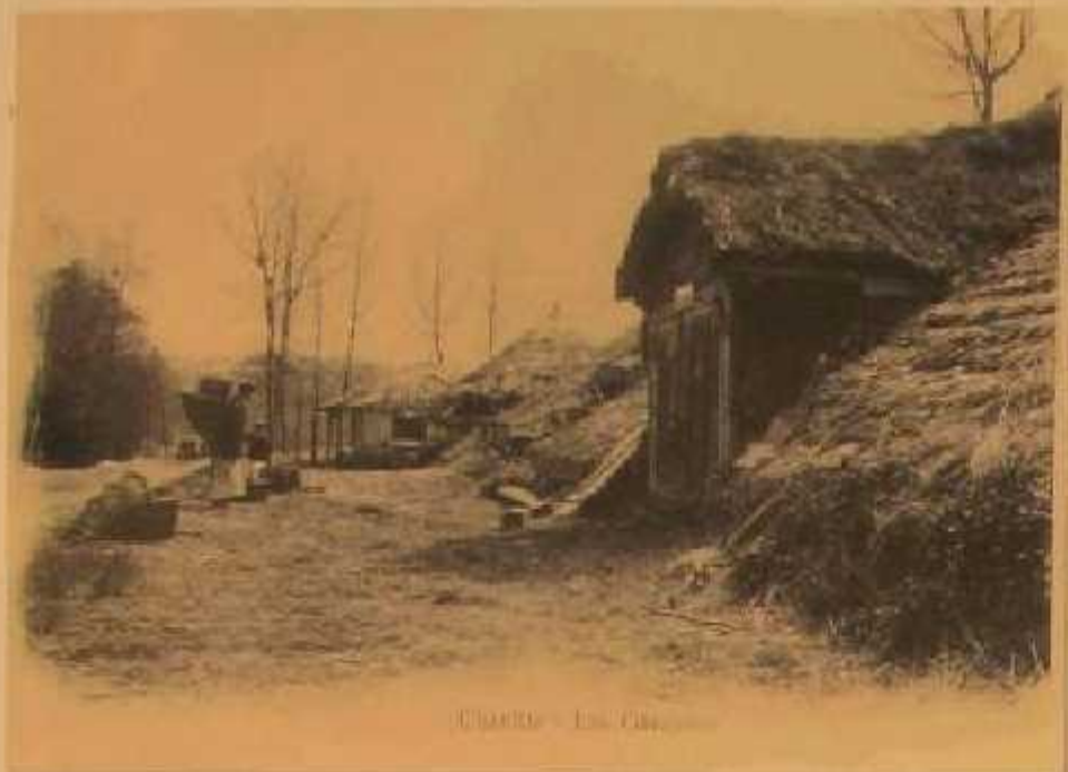
CHAVILLE - Les Glacières