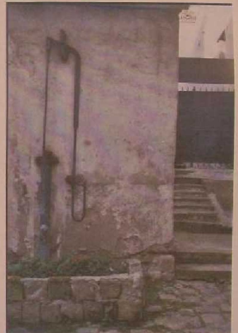
1144 avenue Roger Salengro Chaville