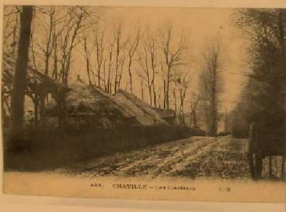
448. CHAVILLE - Les Glacières