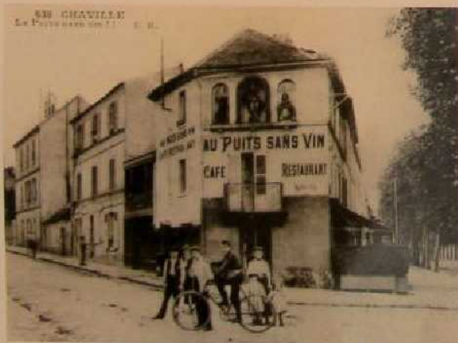
La fontaine du Puits sans Vin