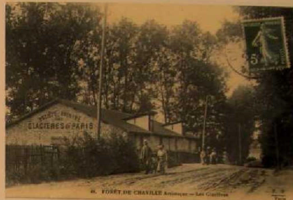
H. FORÊT DE CHAVILLE Antiquaire - Les Glacières

Puis Auguste Bonnafous gère la succursale de Chaville des Glacières de Paris près de l'étang de Brisemiche. Des cartes photos montrent des bâtiments trapus aux murs couverts où les pains de glace reposaient sur des traverses. Le métier était artisanal, on chargeait la glace sur des voitures à chevaux qui étaient pesés à la sortie comme à l'entrée et qui allaient livrer à la clientèle, on découpait alors les pains au pic, à la quantité voulue.