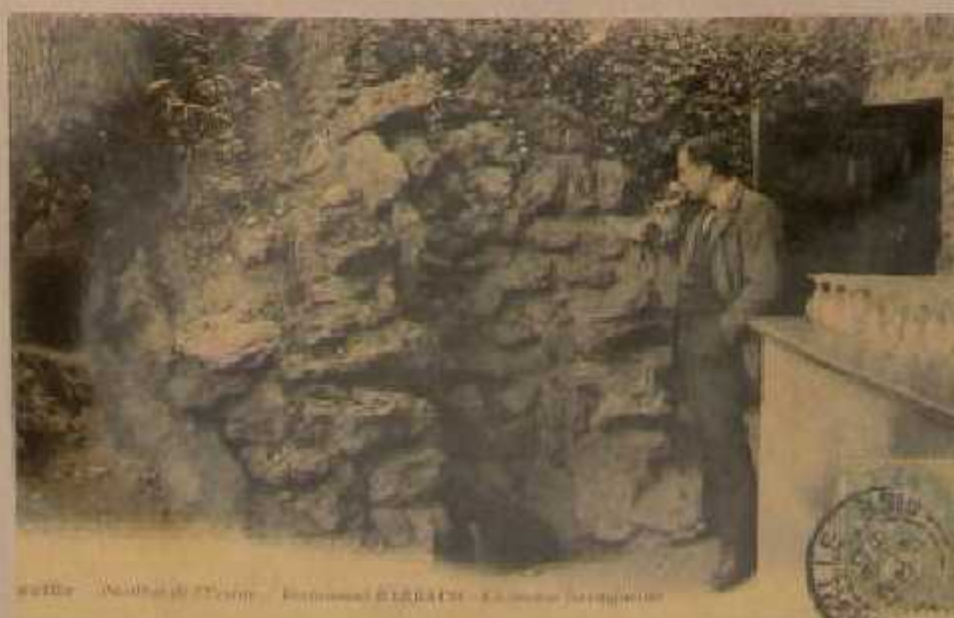
Chaville - Restaurant Barnaud - La Source