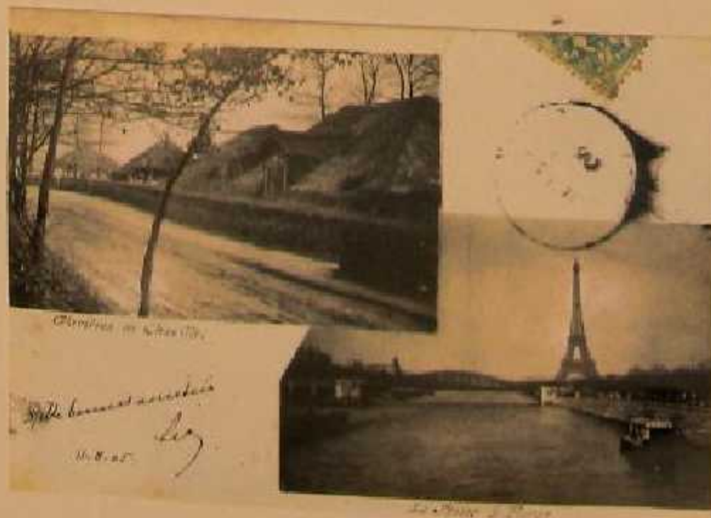
Chaville de l'autre côté