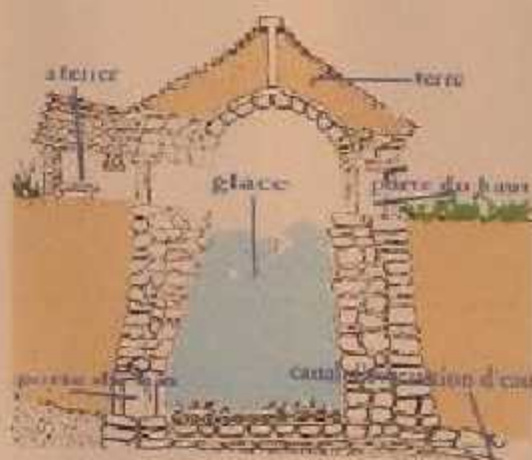
Schéma de la glacière de Chaville