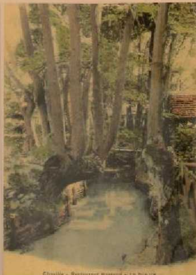
Chaville - Restaurant Barnaud - La Source