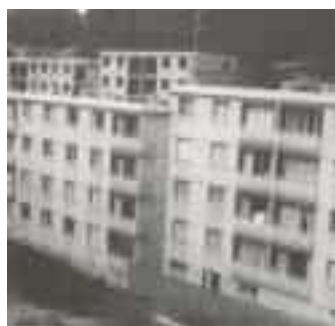
« Vivre » et « Vaincre »