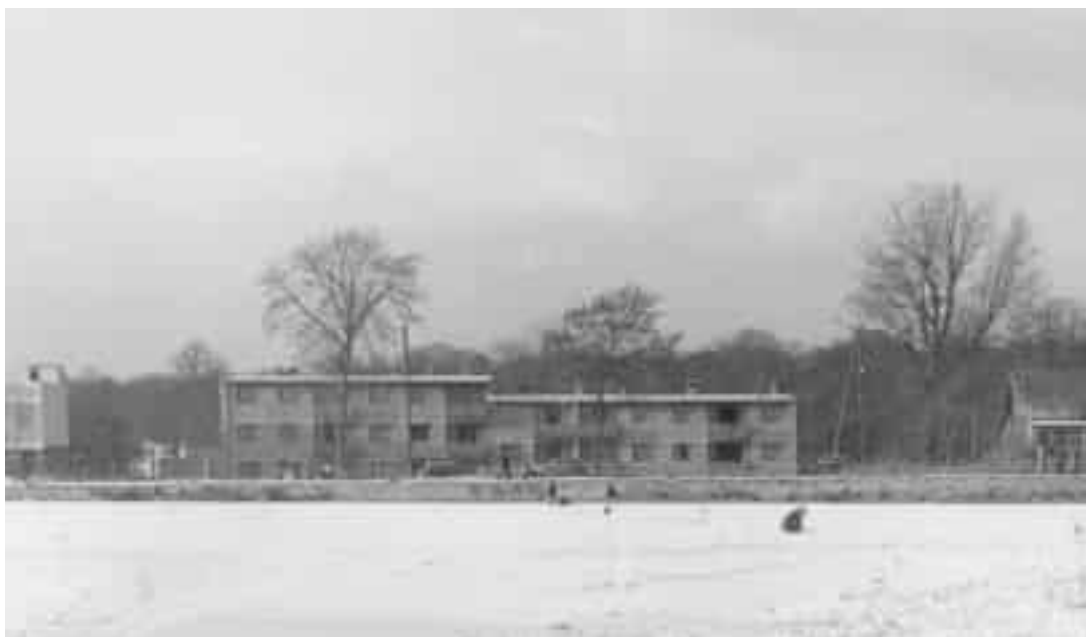
L'immeuble « Vivre » en chantier, route Sablée, hiver 1955.

Journal Le Monde, article du 15 février 1955 : « Le premier immeuble collectif édifié à Chaville, dans la région parisienne, depuis la fin de la guerre a été inauguré hier dimanche par le président de la société coopérative d'HLM de l'Association Populaire des logements de Chaville. Grâce aux efforts conjugués des animateurs de la coopérative, de l'architecte, des entrepreneurs et des futurs locataires qui ont fourni un apport-travail de cinq mille heures, la construction a été terminée en moins d'un an ».