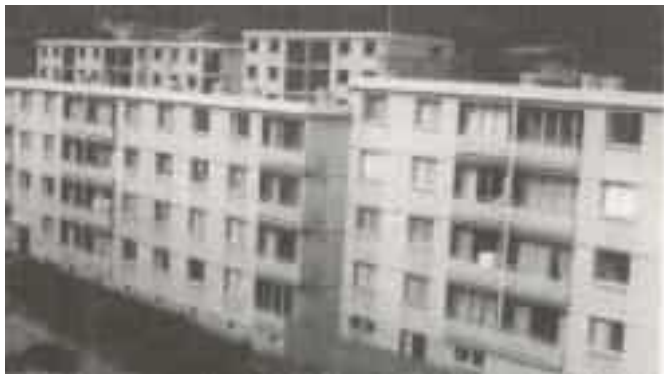
Les immeubles du groupe « Vaincre ».