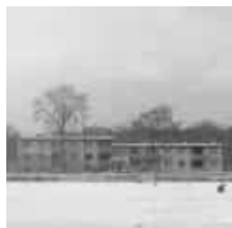
Une photo, une histoire

Et aussi L'éditorial L'actualité Avant...Maintenant