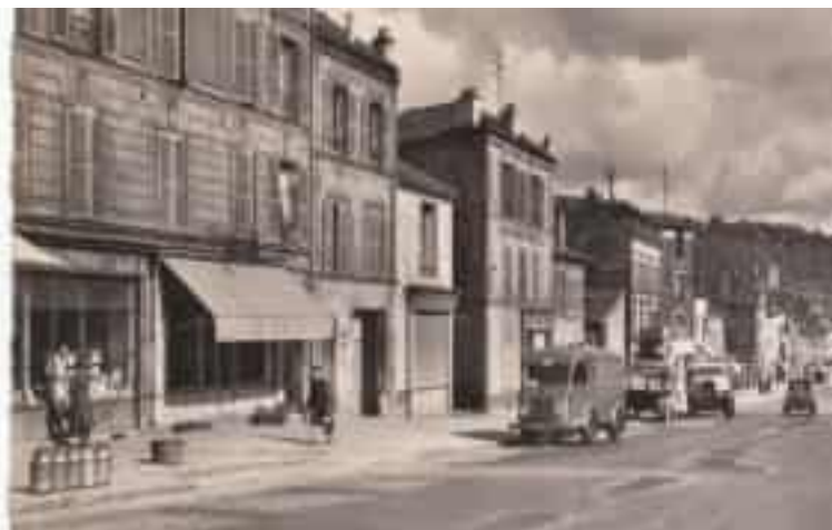
L'avenue Roger Salengro dans les années 1950, avec à gauche la librairie « Chez Nous ».